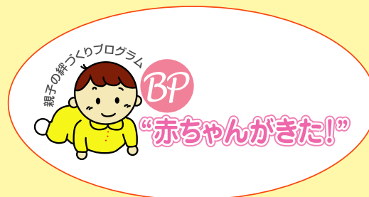
BPプログラムのロゴマーク